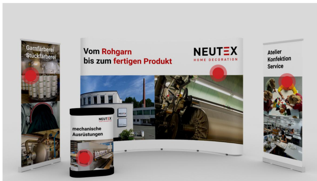
Beispielstand 1: Blankostand individualisiert mit Firmendesign

NEUTEX HOME DECORATION Member of HOFTEX GROUP