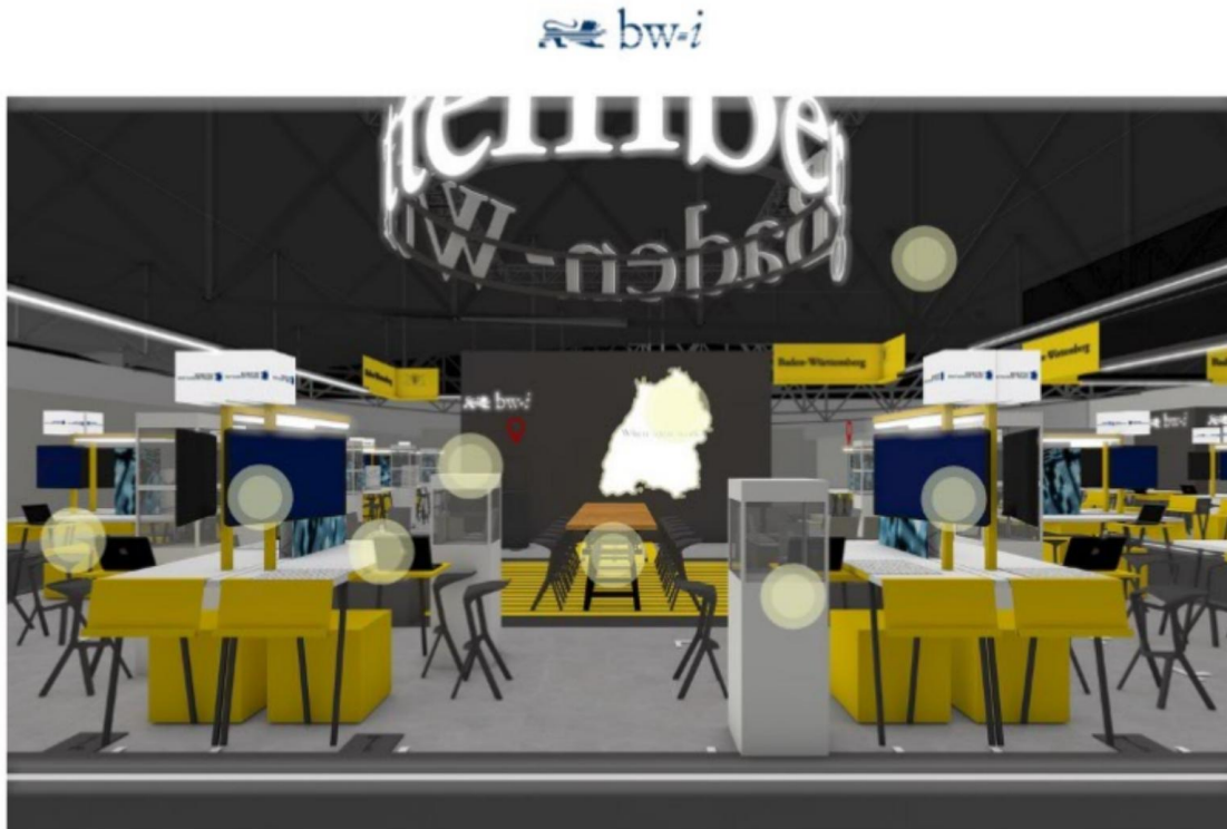
Beispielstand 2: mit CAD-Daten eines vergangenen Messestands