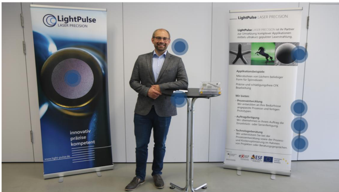
Beispielstand 3: Foto von vergangem Messeauftritt

AFBW – Allianz Faserbasierte Werkstoffe Baden-Württemberg