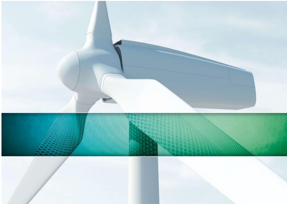
Energie, Umwelt und Ressourceneffizienz

DEUTSCHE INSTITUTE FÜR TEXTIL+FASERFORSCHUNG