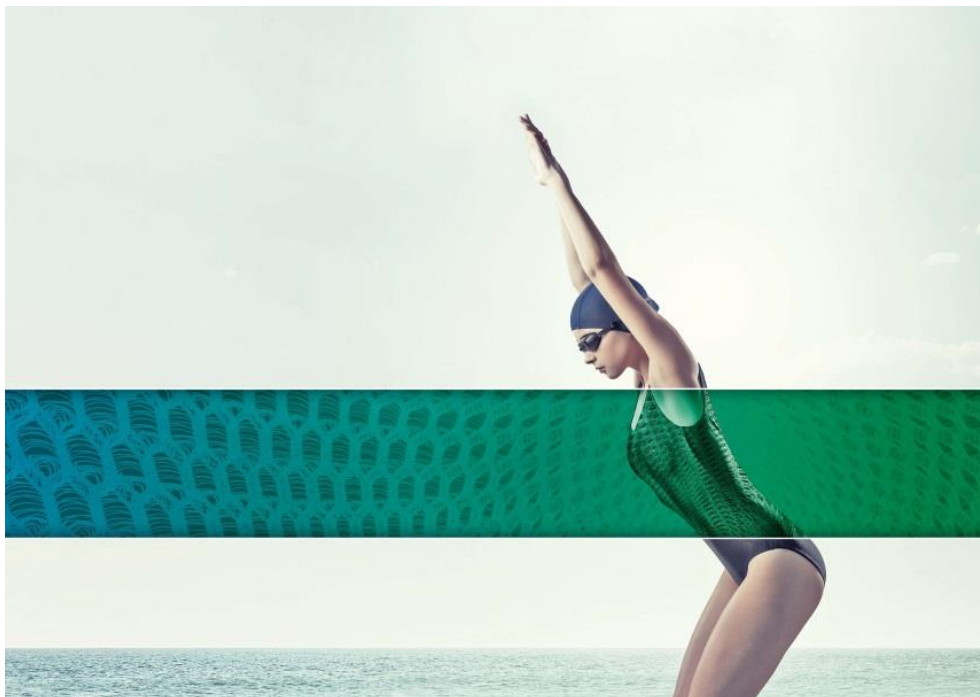
Bekleidung und Heimtextilien